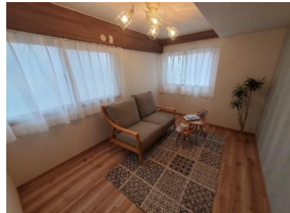
室内写真(※家具は別売りとなります。)